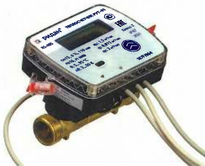
Рисунок 1 – Общий вид теплосчетчиков РУТ-01

Схема пломбировки от несанкционированного доступа представлена на рисунке 2.